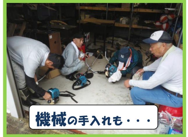
機械の手入れも・・・