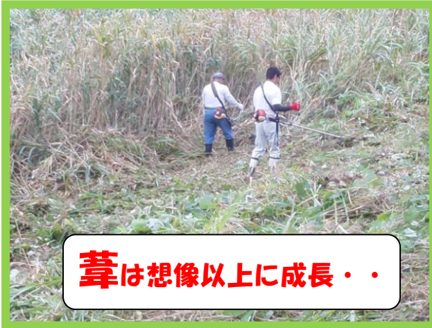
葎は想像以上に成長・・・

平成27年の夏も終わりました。今年も全国的に台風や大雨による災害が多発しました。地球温暖化の影響で、今後ますます自然災害による被害の大きさが懸念されています。少しでも勝間田川の氾濫を防止しようと「こまめな活動」を展開していきます。